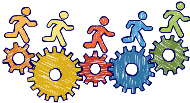
ORGANIZZAZIONE DEI SERVIZI